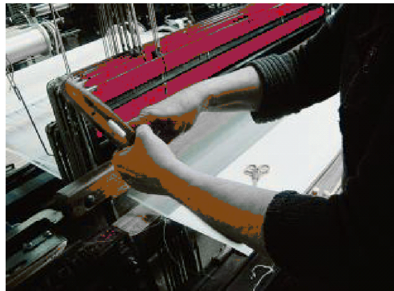
La dernière tisseuse à domicile pour Veraseta était de Coublanc. Elle a terminé sa carrière en 1995